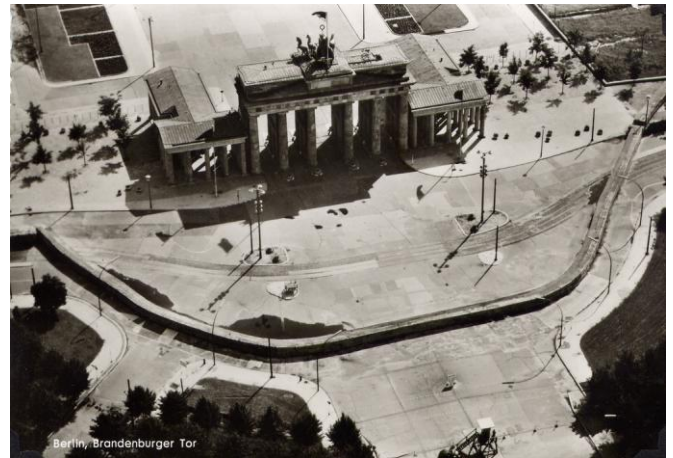
Reelaborado de: FUENTES, Juan Francisco / LA PARRA LÓPEZ, Emilio; "Historia Universal del Siglo XX: de la I Guerra Mundial al ataque a las Torres Gemelas"; Madrid, España; 2001.

En los 28 años y tres meses de vida del Muro siete personas fueron detenidas a diario por querer huir del régimen germano oriental. 240 personas fueron muertas y 75.000 encarceladas por intentar cruzar el muro. Quienes pagaban más cara su osadía eran los guardias. Lo intentaron con éxito 2.500, pero otros 5.500 fracasaron y pagaron con una media de cinco años de cárcel.